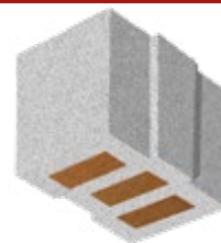
L x B x H in cm: 24,7 x 42,5 x 24,9 14 DF