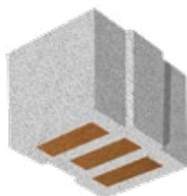
L x B x H in cm: 24,7 x 36,5 x 24,9 12 DF