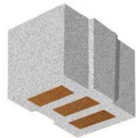
L x B x H in cm: 24,7 x 42,5 x 24,9 14 DF