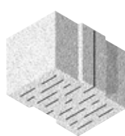
L x B x H in cm: 24,7 x 36,5 x 24,9 12 DF

BISOGREEN® Ergänzungssteine sind der wertvolle Garant für homogenes Mauerwerk – Längen-/Höhenausgleich, Deckenabmauerung, schlankes Pfeilermauerwerk oder Ausfachungen. Die passenden BISOGREEN® Innenwandsteine für tragende und nichttragende Wände sind auf Seite 24 dargestellt.