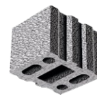
L x B x H in cm: 24,7 x 30,0 x 23,8 10 DF