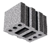
L x B x H in cm: 24,7 x 36,5 x 23,8 12 DF