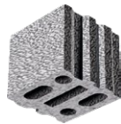
L x B x H in cm: 24,7 x 24,0 x 23,8 8 DF