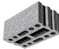
L x B x H in cm: 49,7 x 30,0 x 23,8 20 DF