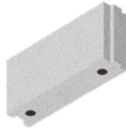
L x B x H in cm: 49,7 x 11,5 x 24,8 8 DF