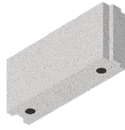
L x B x H in cm: 49,7 x 11,5 x 24,8 8 DF