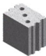
L x B x H in cm: 24,7 x 17,5 x 23,8 6 DF