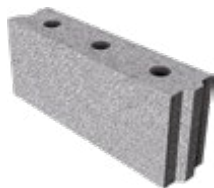
L x B x H in cm: 49,7 x 11,5 x 23,8 8 DF/N+F