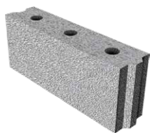
L x B x H in cm: 49,7 x 11,5 x 23,8 8 DF/N+F