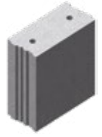
L x B x H in cm: 49,7 x 24,0 x 49,8 32 DF