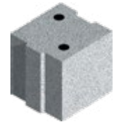
L x B x H in cm: 24,7 x 24,0 x 24,8 8 DF