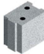
L x B x H in cm: 24,7 x 17,5 x 24,8 6 DF