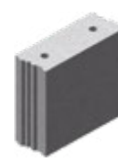
L x B x H in cm: 49,7 x 20,0 x 49,8 28 DF