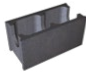
L x B x H in cm: 49,8 x 17,5/24,0/30,0 x 24,8 Normalstein

Schalungssteine lassen sich einfach und schnell versetzen und verbinden sich durch den vor Ort eingelegten Bewehrungsstahl und eingefüllten Beton zu einer monolithischen Wand, die im Garten- und Landschaftsbau viele Einsatzmöglichkeiten bietet.