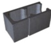
L x B x H in cm: 48,8 x 17,5/24,0/30,0 x 24,8 Endstein