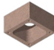
L x B x H in cm: 39,0 x 39,0 x 24,0