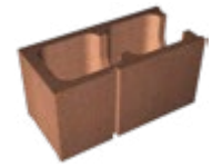
L x B x H in cm: 48,8 x 17,5/24,0 x 24,8 Endstein