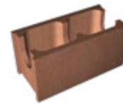
L x B x H in cm: 49,8 x 17,5/24,0 x 24,8 Normalstein