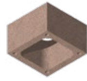
L x B x H in cm: 43,0 x 43,0 x 24,0