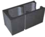
L x B x H in cm: 48,8 x 17,5/24,0/30,0 x 24,8 Endstein