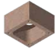
L x B x H in cm: 43,0 x 43,0 x 24,0