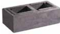
L x B x H in cm: 38,0 x 19,0 x 12,0 Mauerstein 1/1