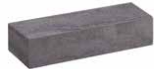
L x B x H in cm: 57,0 x 19,0 x 12,0 Long Abschlussstein 1 1/2