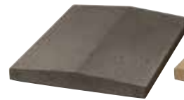
L x B x H in cm: 49,0 x 35,0 x 3,5 - 5,5 - 3,5