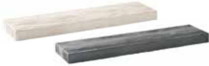
L x B x H in cm: 79,5 x 20,0 x 5,0 Terrassenbohle