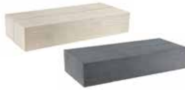
L x B x H in cm: 79,5 x 40,0 x 15,0 Blockstufe