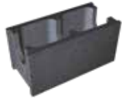
L x B x H in cm: 49,8 x 17,5/24,0/30,0 x 24,8 Normalstein