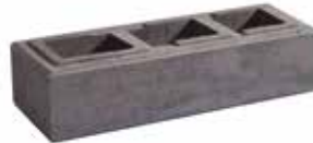
L x B x H in cm: 57,0 x 19,0 x 12,0 Long Mauerstein 1 1/2