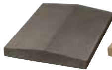
L x B x H in cm: 49,0 x 25,0 x 3,5 - 5,5 - 3,5