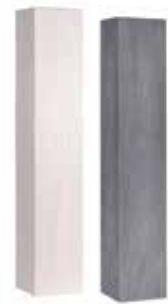
L x B x H in cm: 79,5 x 14,5 x 15,0 Palisade