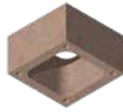
L x B x H in cm: 39,0 x 39,0 x 24,0